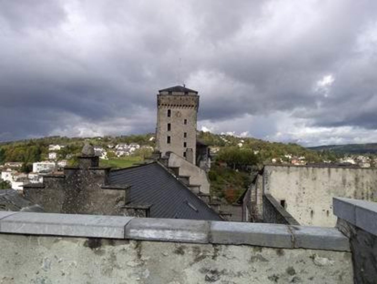
Le château de Lourdes