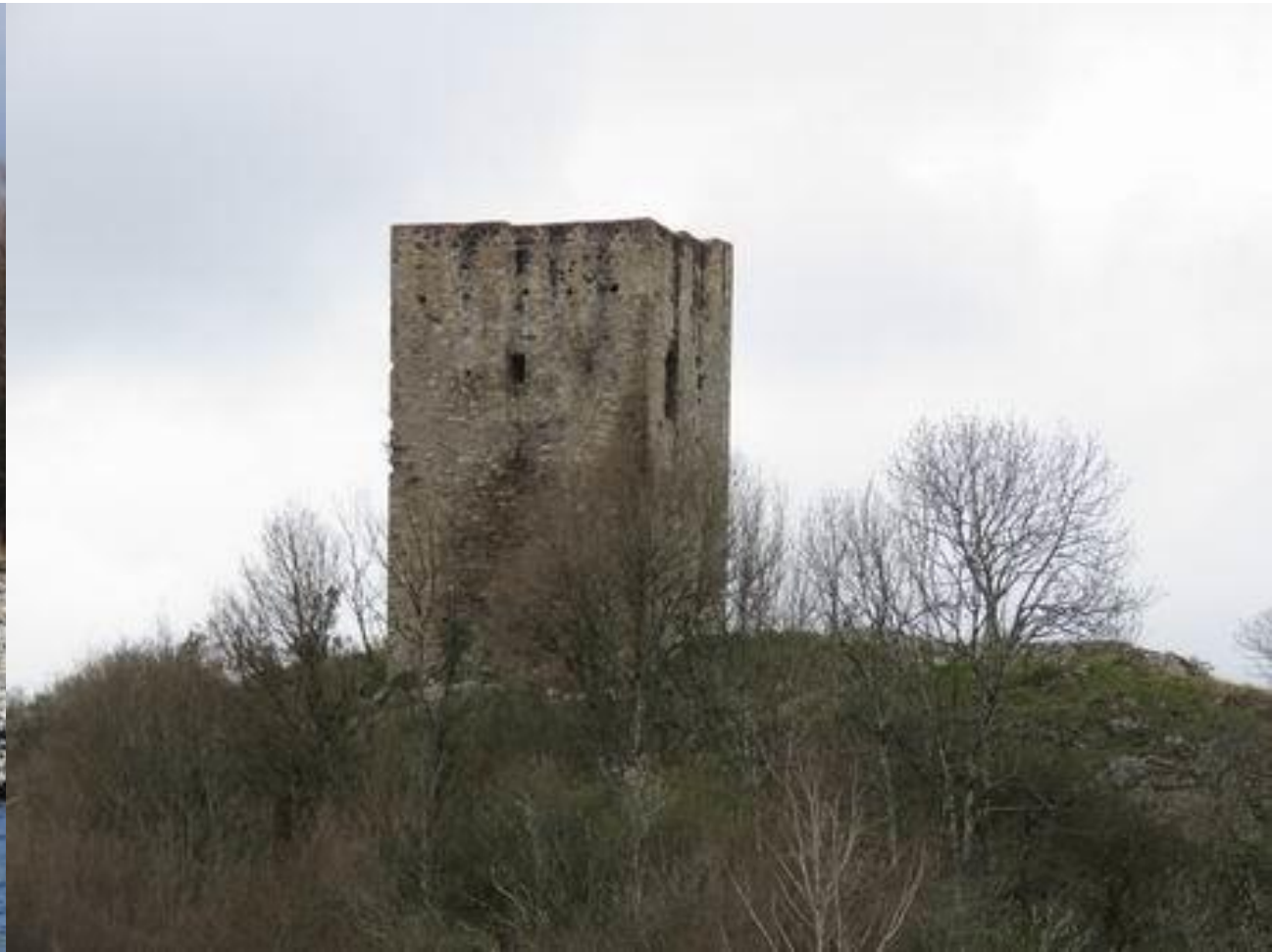
Avezac – Les Baronnie