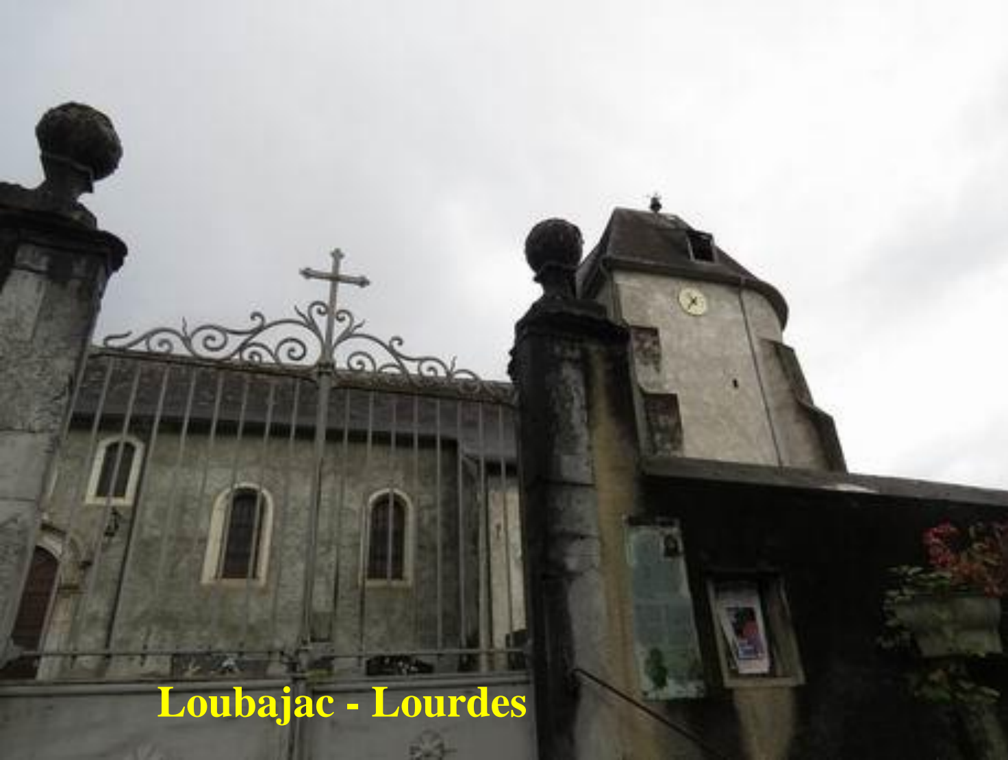
Loubajac - Lourdes