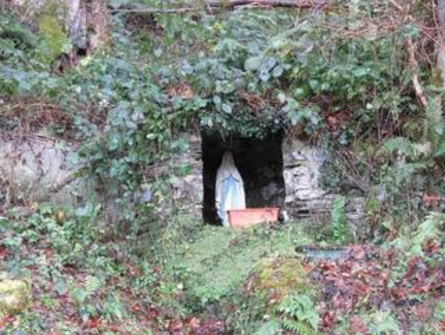
Près d'Arrens-Marsous Val d'Azun – Argelès-Gazost