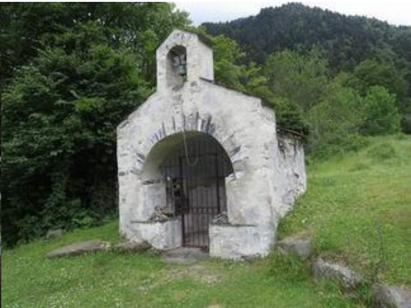
Chapelle du Chiroulet – Vallée de Lesponne Bagnères de Bigorre