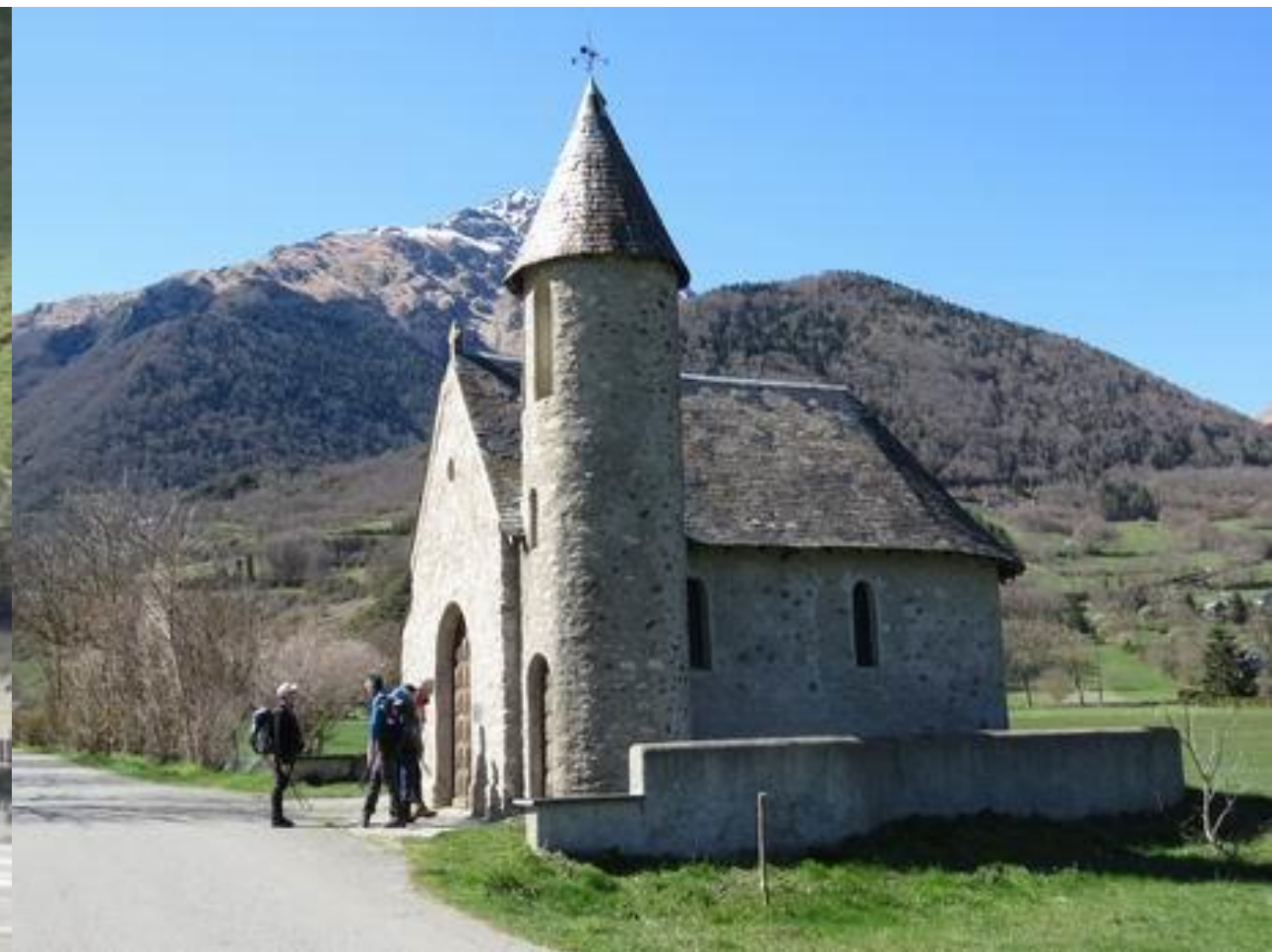
Chapelle du Bouchet – Guchen Vallée d’Aure