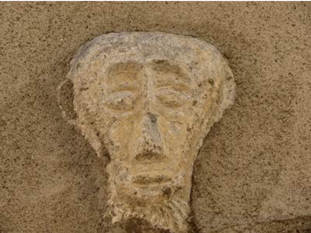
Betpouey – Vallée de Barèges