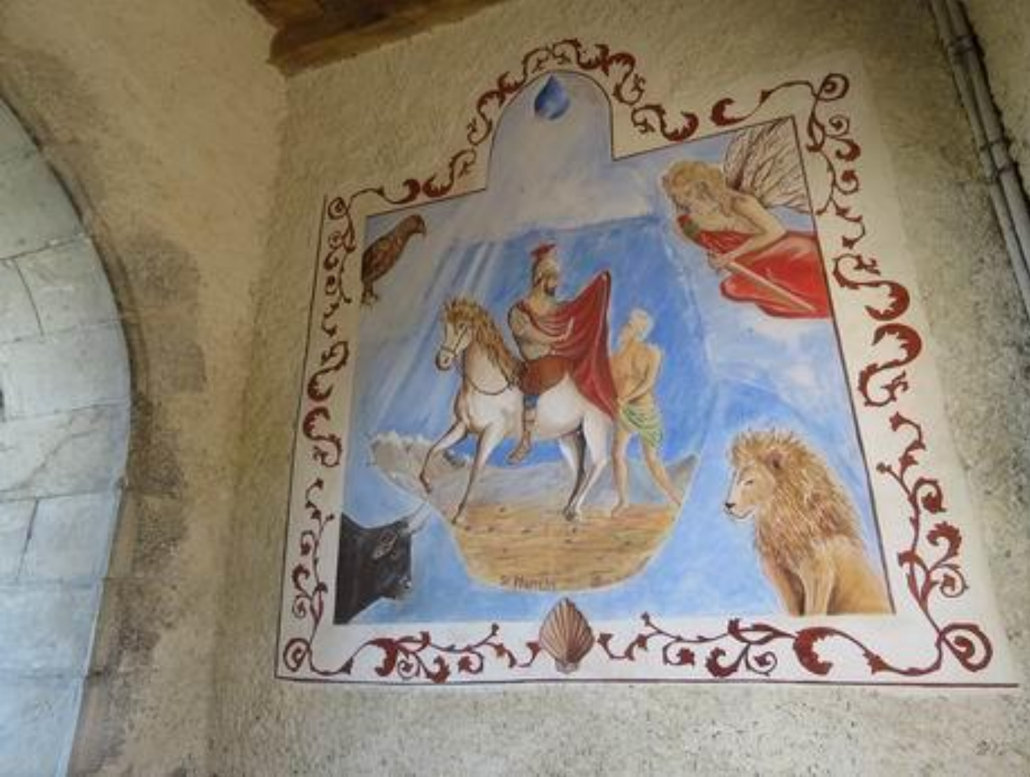
Uzer – Les Baronnie