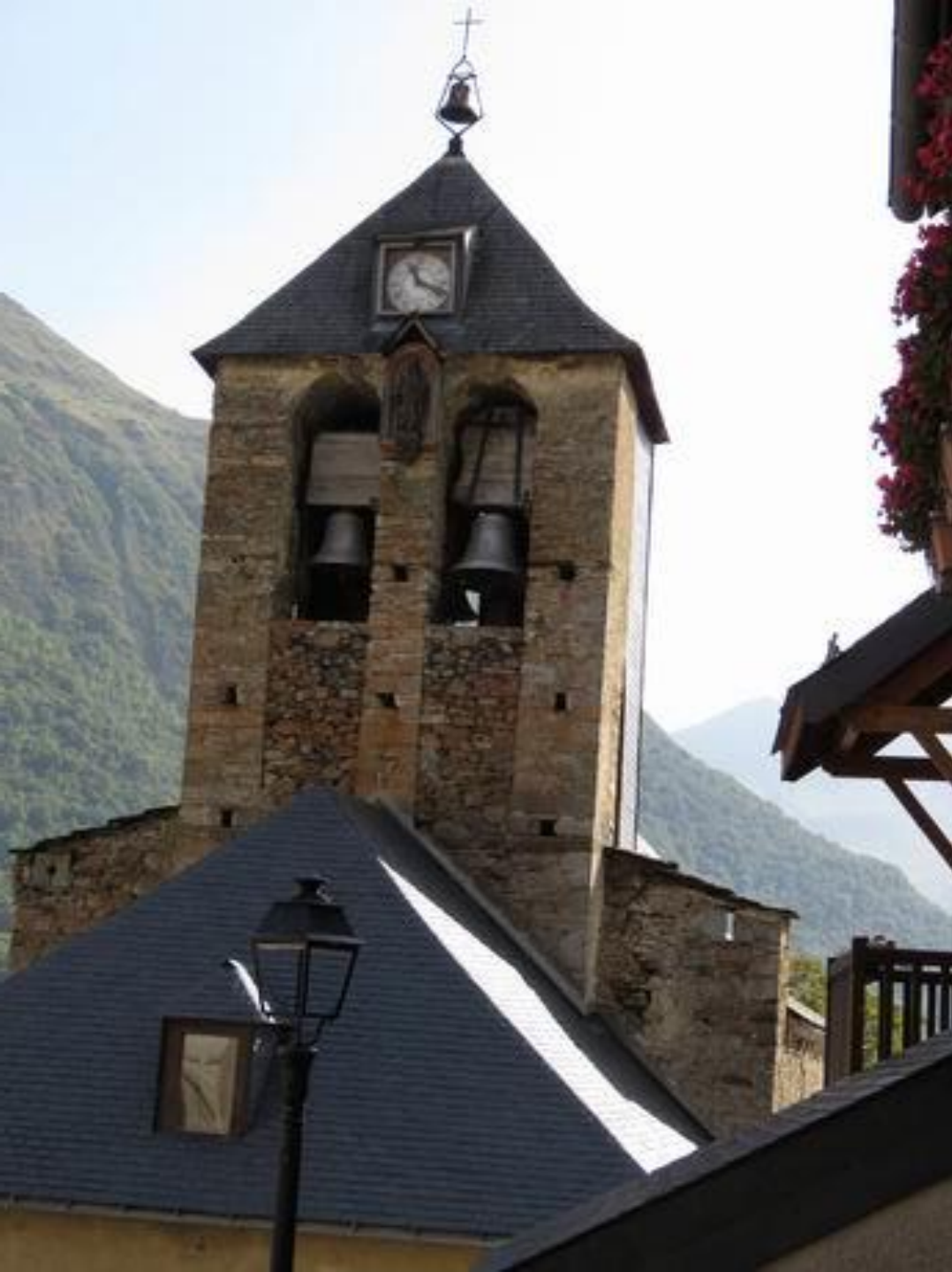
Sazos Vallée de Luz