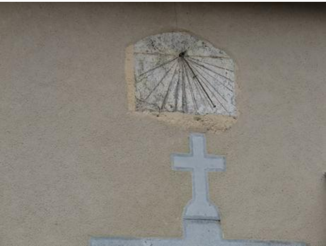
Escala – Plateau de Lannemezan