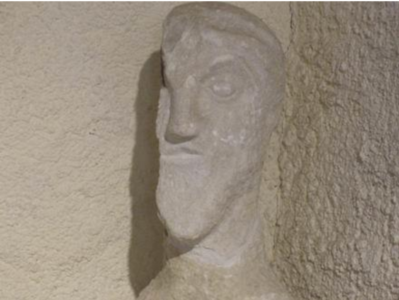
Sacoué-Bramevaque - La Barousse