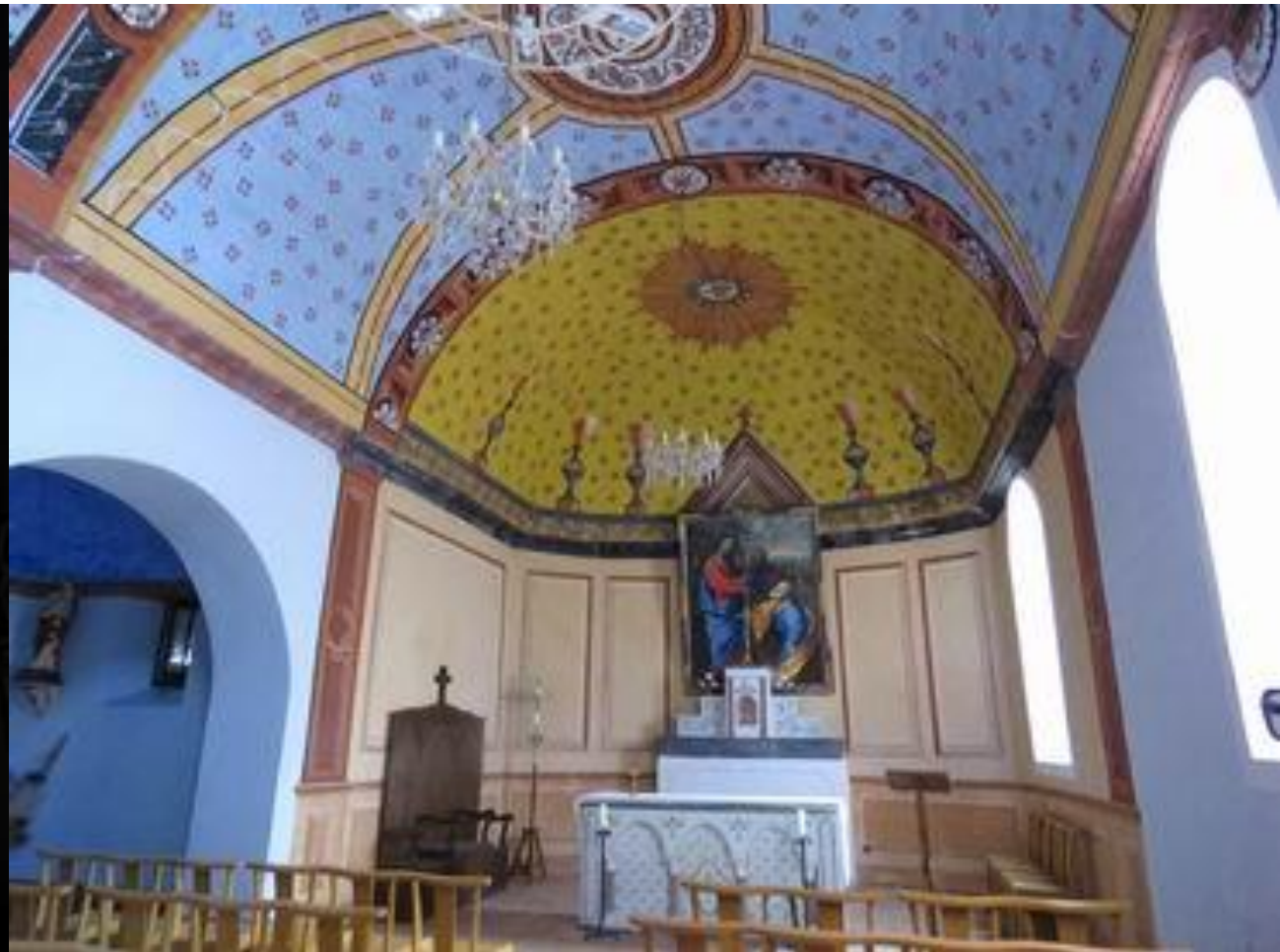
Bettes - Les Baronnie