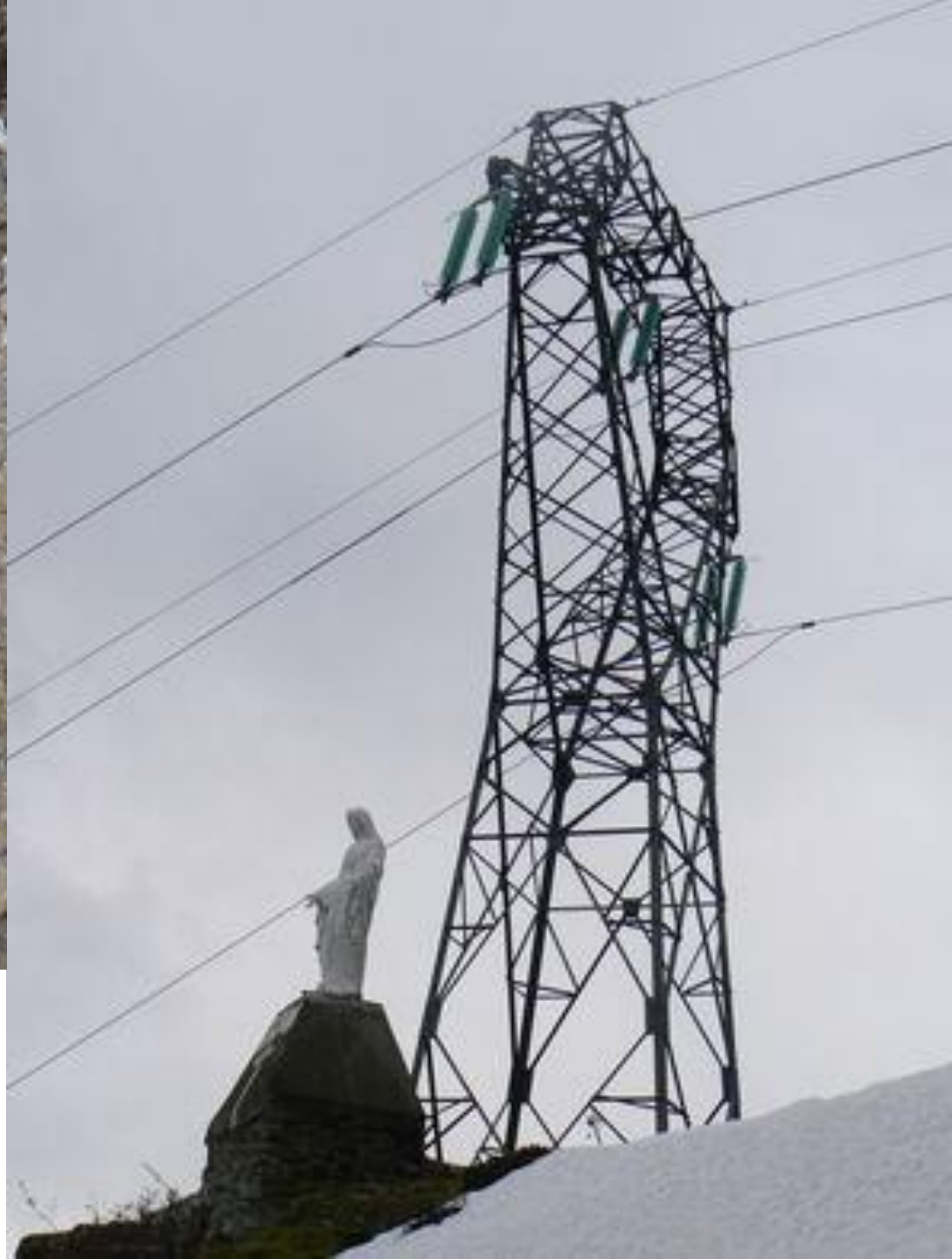
Soum det Mont – Salles - Lourdes