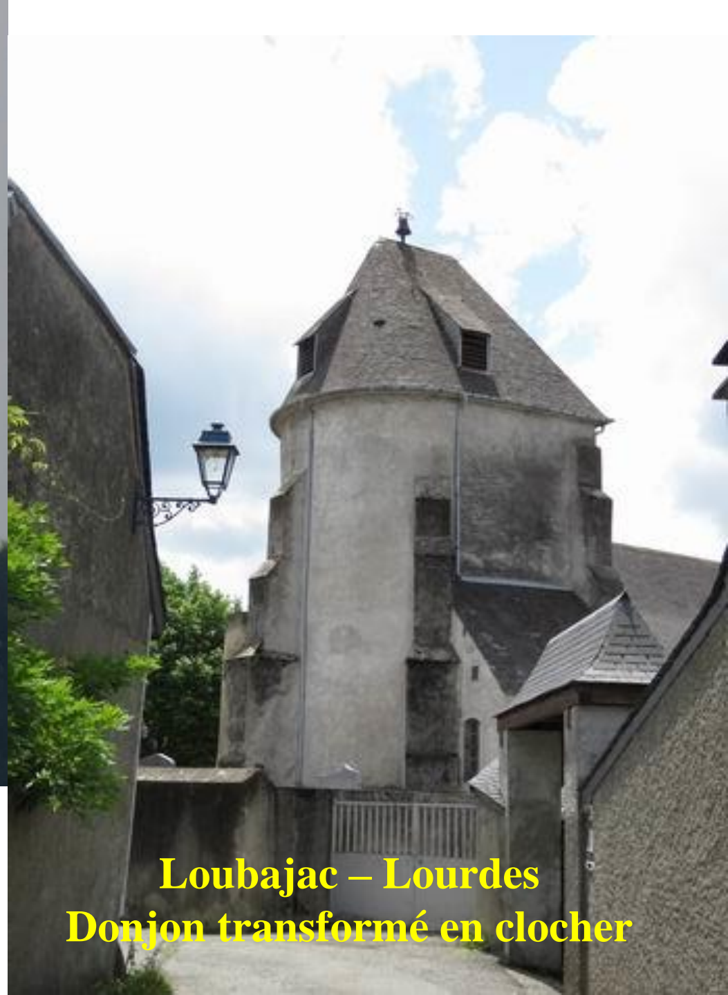
Loubajac – Lourdes Donjon transformé en clocher