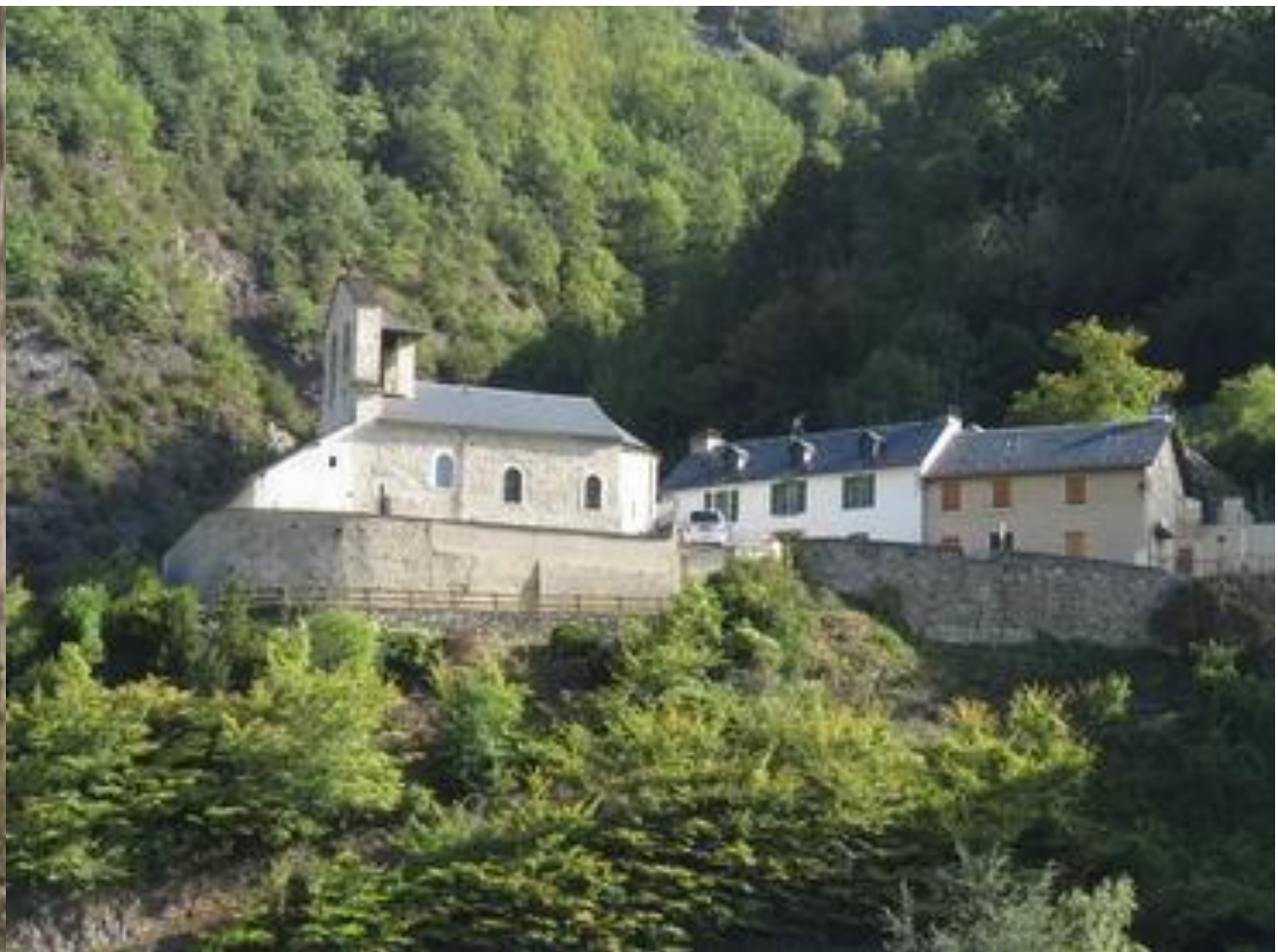
Saligos – Vallée de Luz