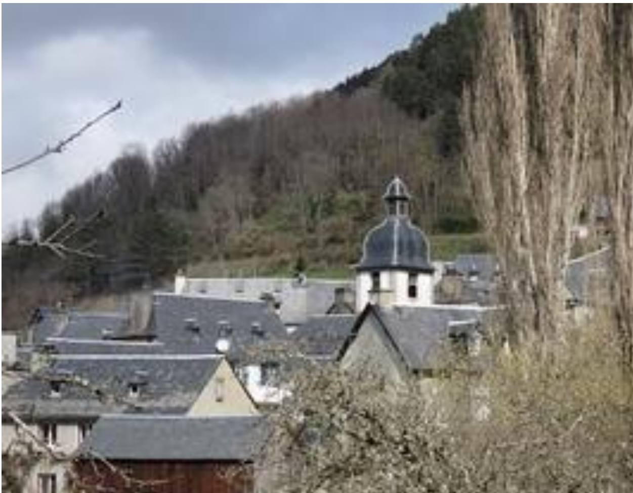
Gouaux – Vallée d'Aure