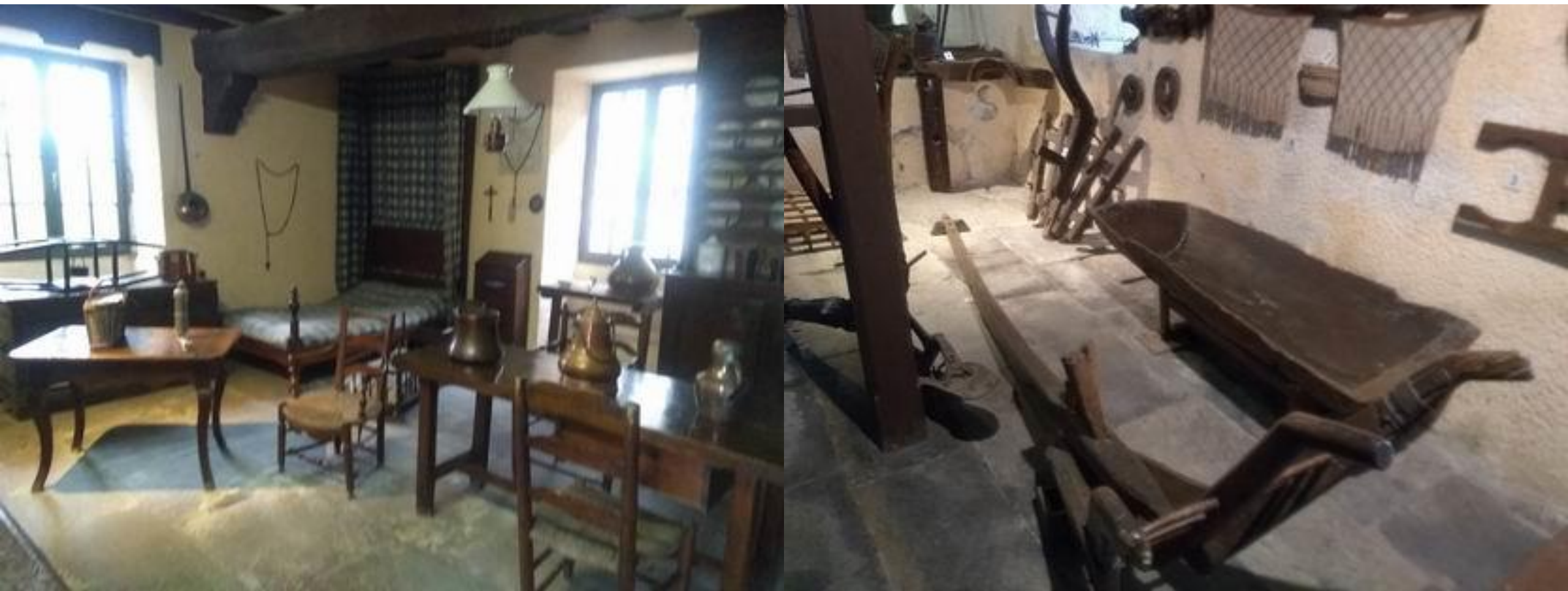
Le musée pyrénéen Château de Lourdes