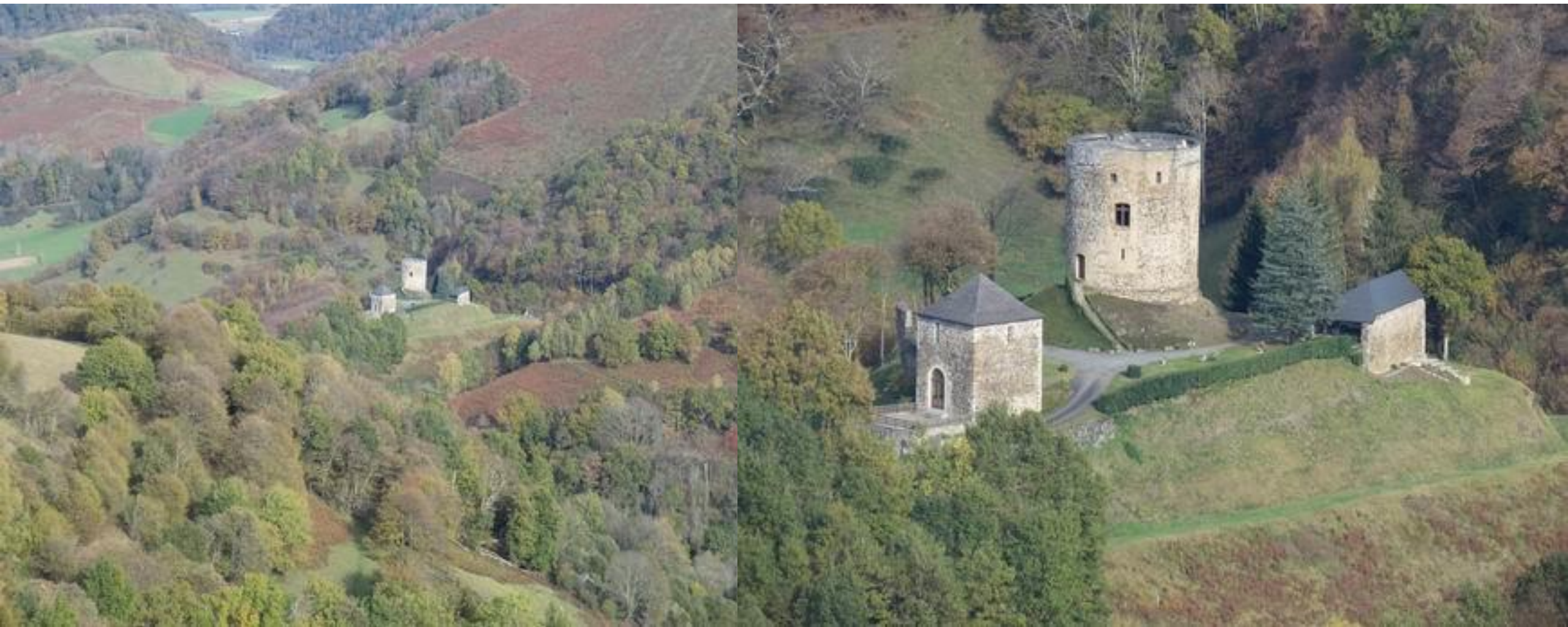
Les Angles - Lourdes