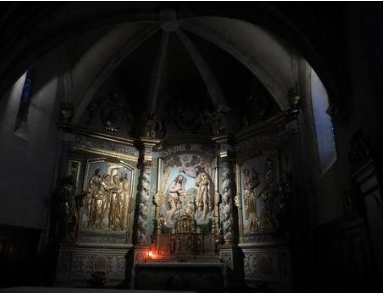
Bartrès - Lourdes