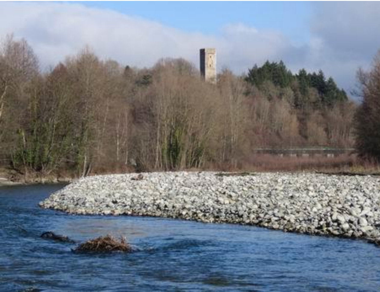
Agos - Lourdes