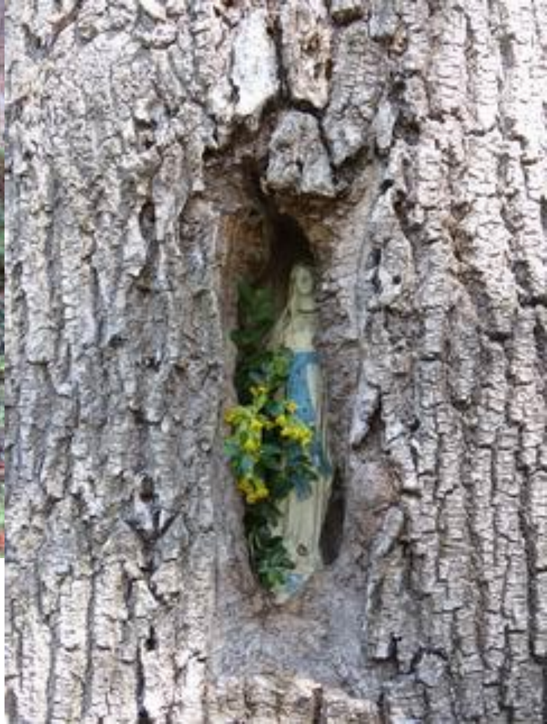
Près de Gouaux Vallée d'Aure