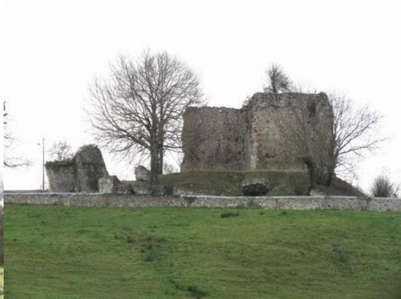
La Barthe-de-Neste Plateau de Lannemezan