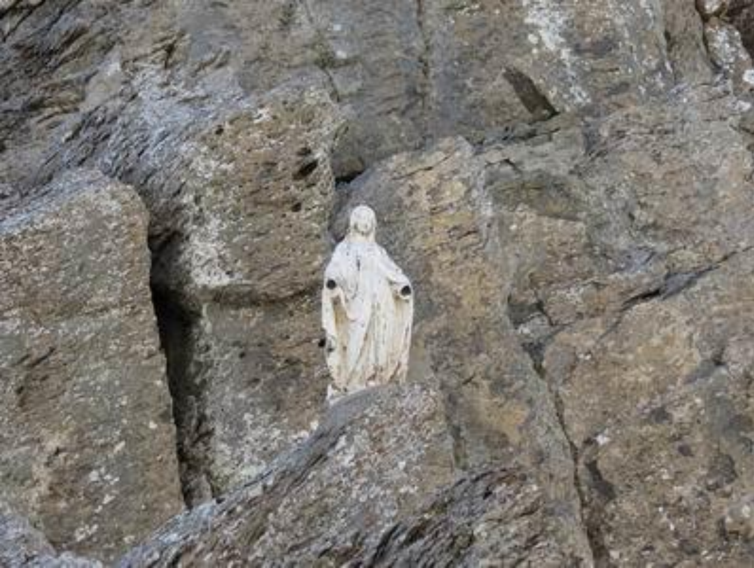
Brèche de Tuquerouye – Cirque d’Estaubé