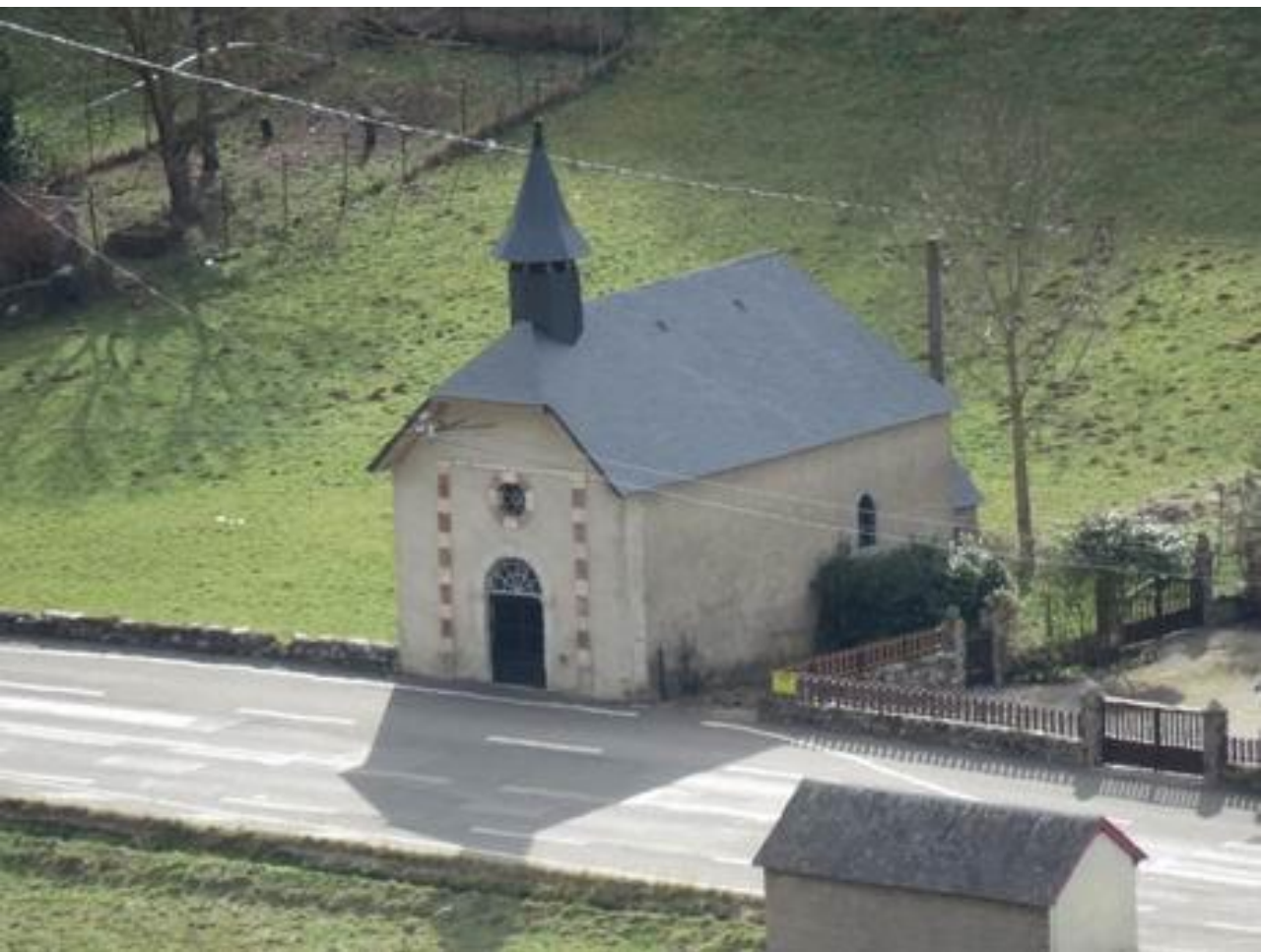
Chapelle St Roch - Campan