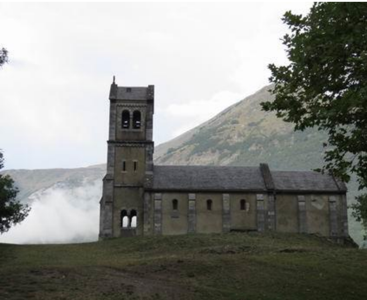
Chapelle Solferino – Luz-St Sauveur