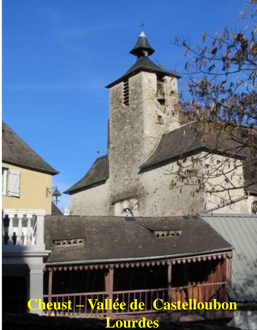
Cheust – Vallée de Castelloubon Lourdes