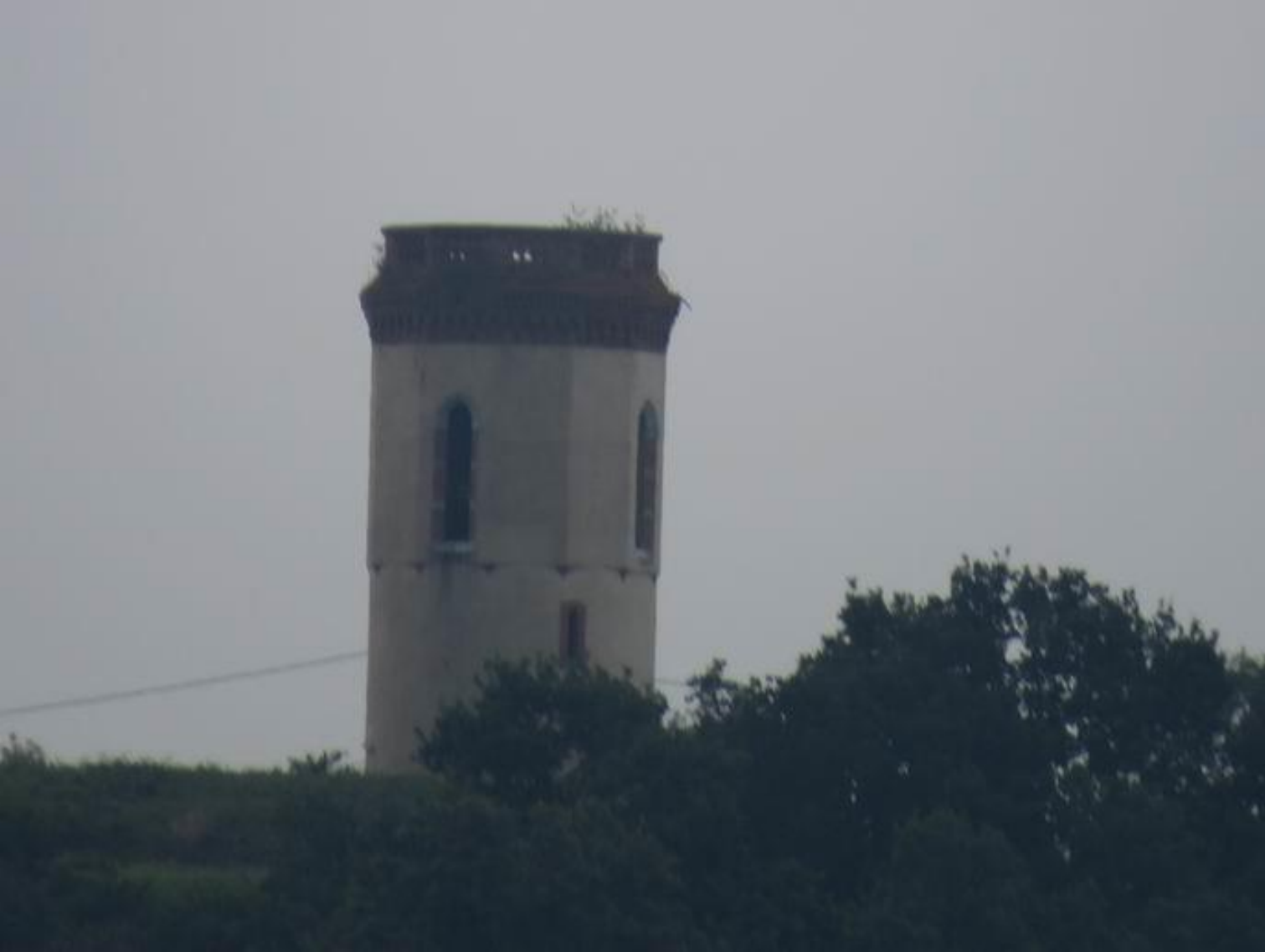
La tour d'Oléac – Tarbes Ancien poste du télégraphe optique de Chappe