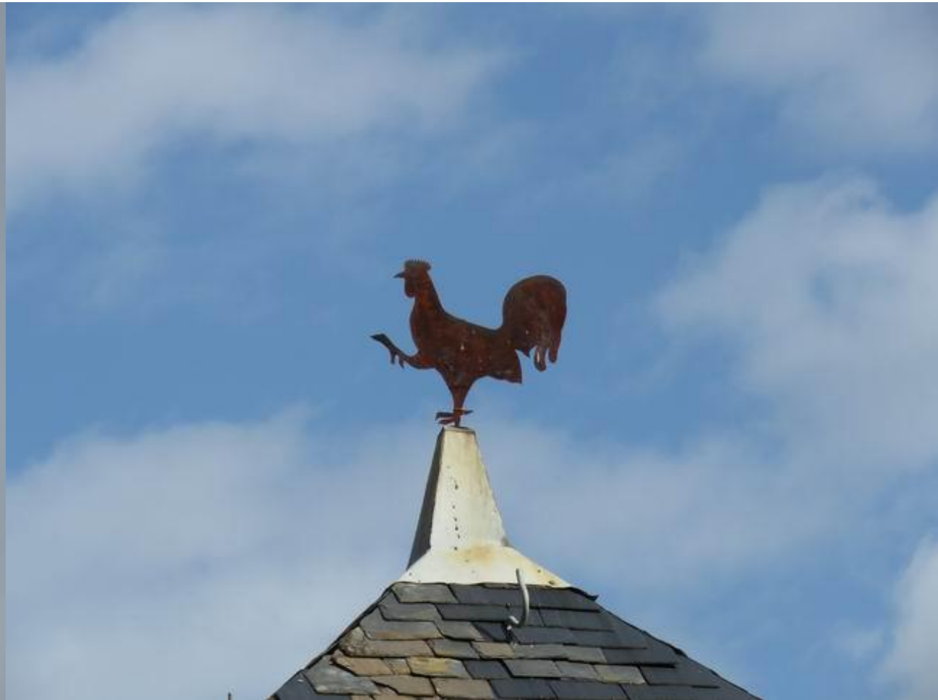
Sazos – Vallée de Luz