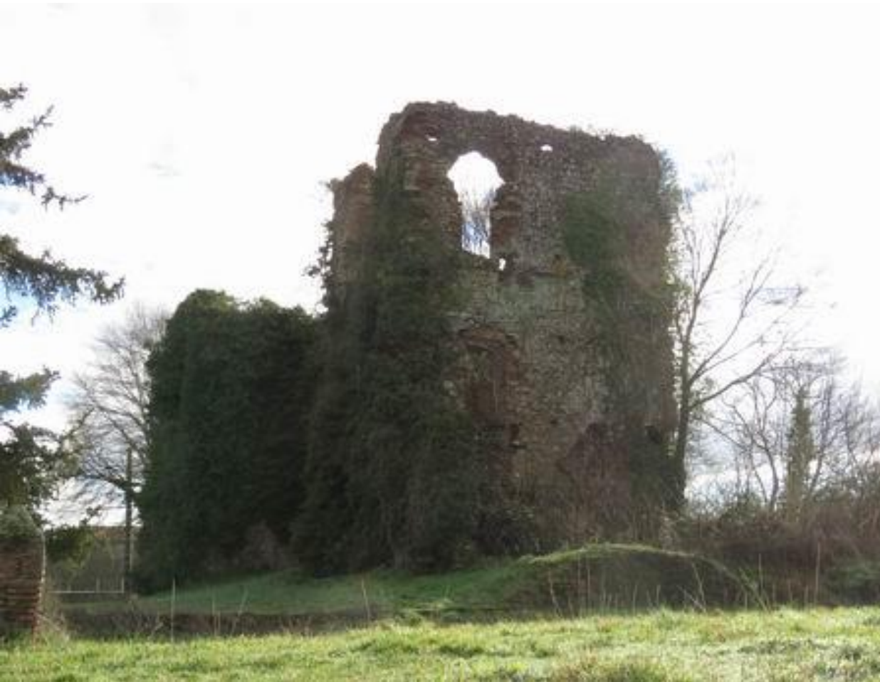
Larreule - Maubourguet