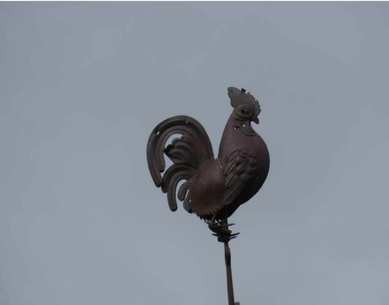
Campanan – Vallée d'Aure