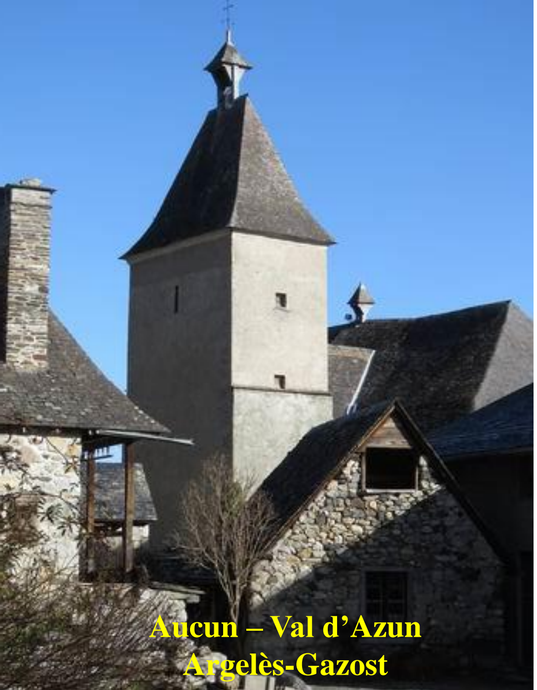
Aucun – Val d'Azun Argelès-Gazost