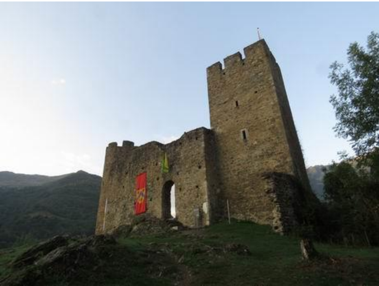
Le château Ste Marie – Esquièze-Sère Luz-St Sauveur