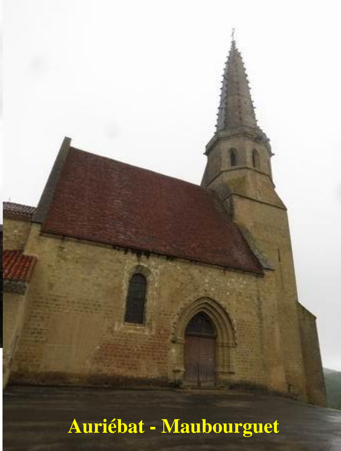
Auriébat - Maubourguet