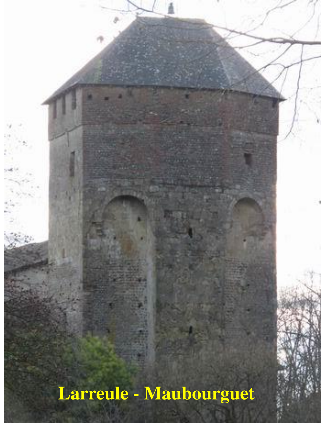
Larreule - Maubourguet