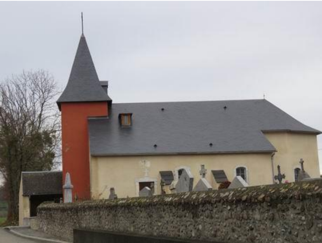
Escala – Plateau de Lannemezan