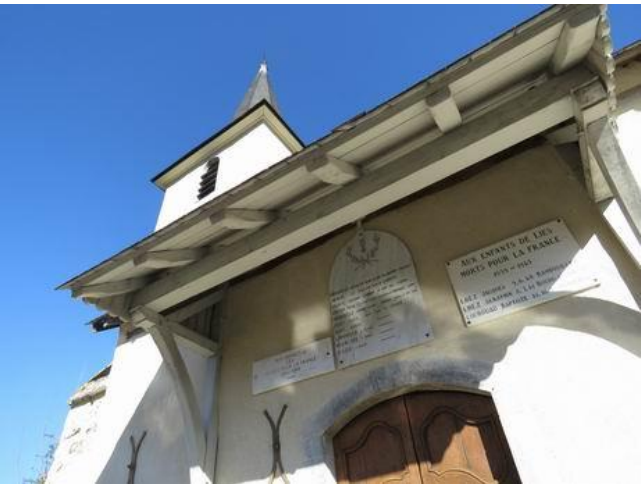
Lies – Les Baronnie