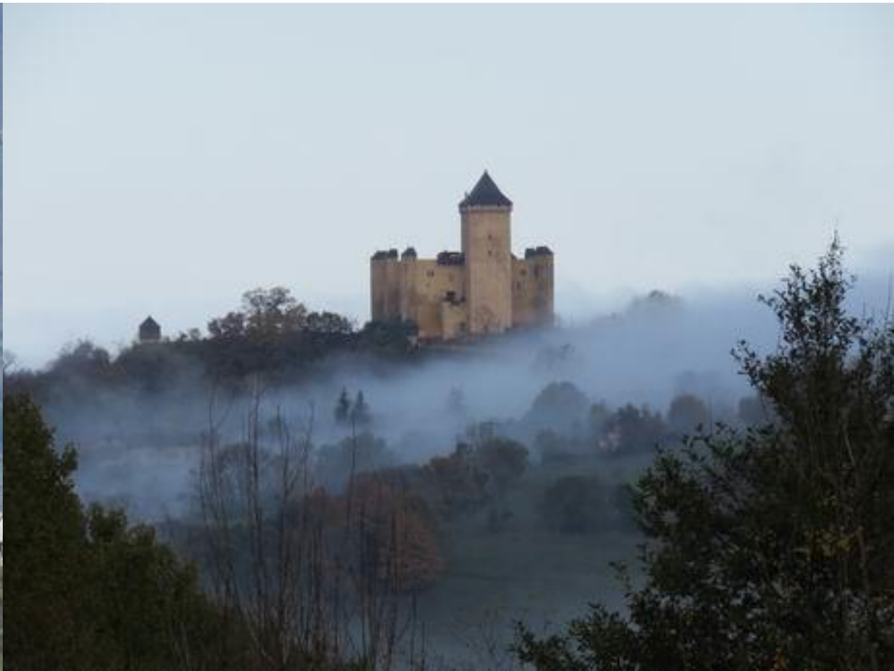
Château de Mauvezin Les Baronnie